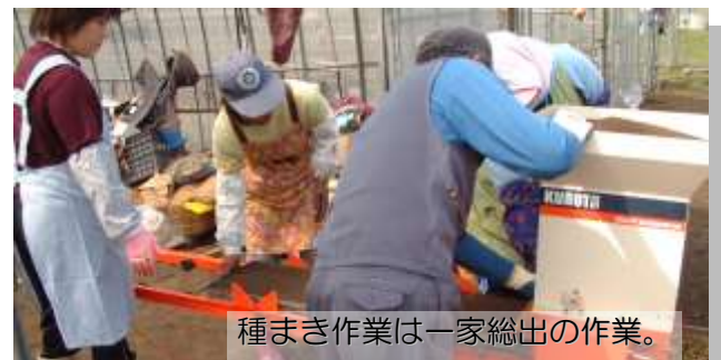
種まき作業は一家総出の作業。

水田の土の中には沢山の種類、膨大な数の微生物が活動しています。私たち人間のお腹では善玉菌と悪玉菌のバランスが崩れると体調が悪くなりますが、イネにとってのお腹を水田土壌、とらえたのが微生物農法です。水田の土も微生物のバランスを整えてやるのがとても重要で、そのバランスが崩れるとイネが病気にかかりやすくなったり、生長が上手くいかなかったりします。有機肥料や堆肥で微生物バランスを良好に保つことで、健康で自ら美味しくなる作物作りをするというのが微生物農法です。