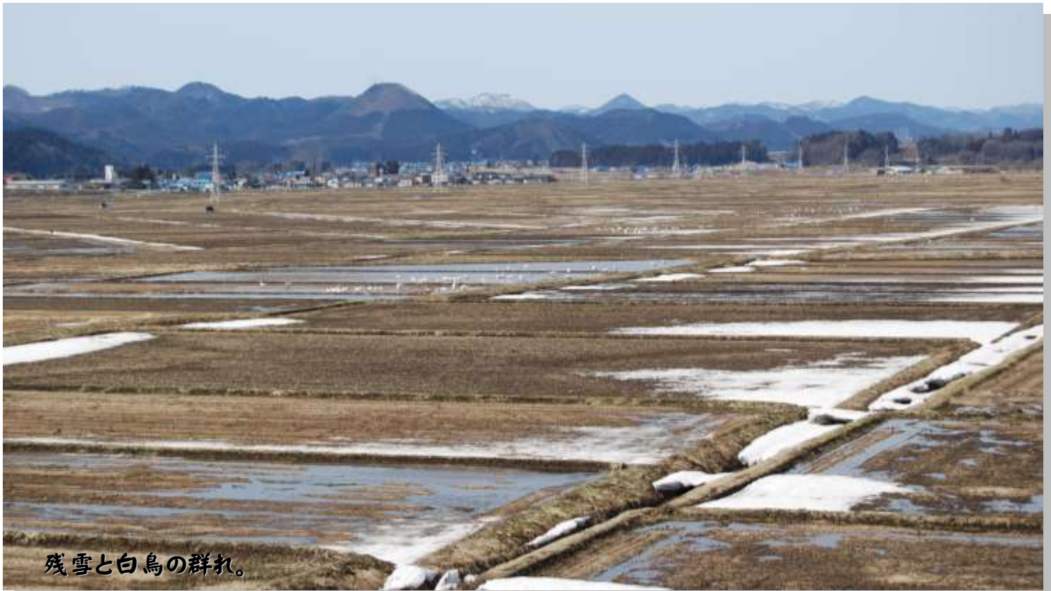
残雪と白鳥の群れ。