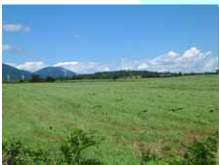
高原の牧場あり・・・