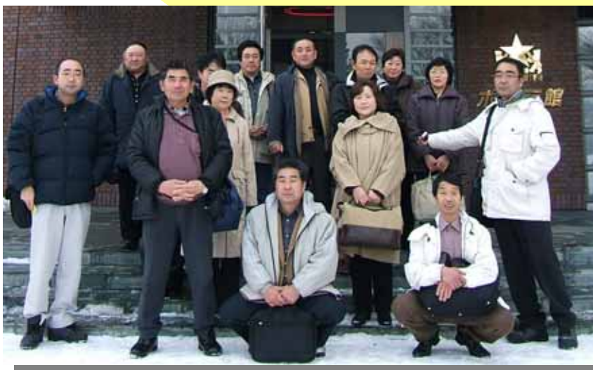
こんな人達が美味しい米づくりに励んでいます！