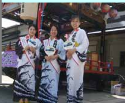
秋田美人あり・・・