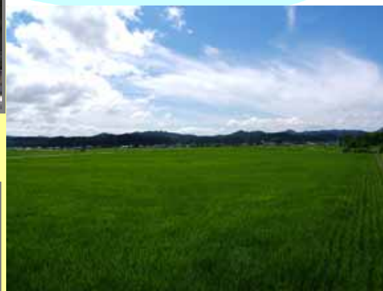
そんな土地にある、水と土と空気に恵まれた良質な田んぼで・・・